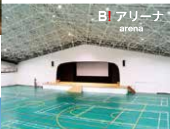
B! アリーナ arena