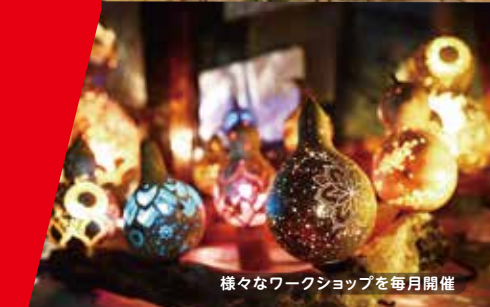
様々なワークショップを毎月開催