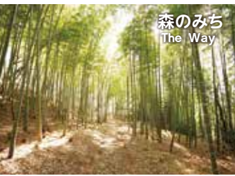
森のみち The Way