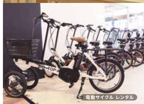
電動サイクル レンタル