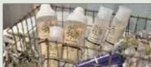
アロマティックビューティ