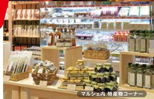
マルシェ内 特産物コーナー