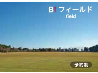
B! フィールド field