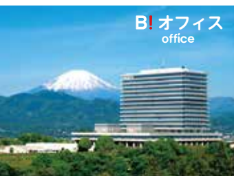
B! オフィス office