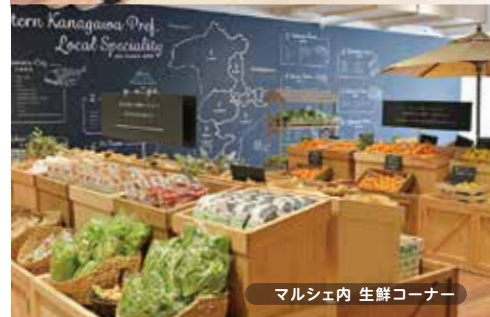
マルシェ内 生鮮コーナー