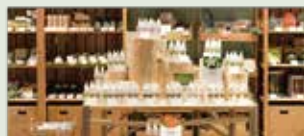
リフレッシュフォレスト