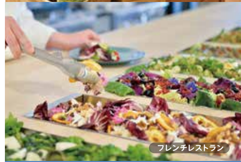
フレンチレストラン