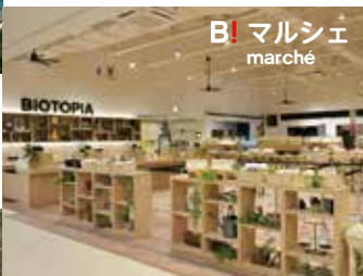
B! マルシェ marché