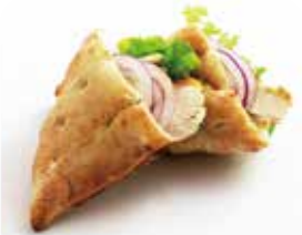
チキン・ピタパン ¥565