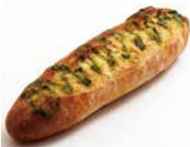
ハーブバターフランス ¥198