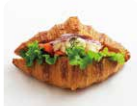
クロワッサンサンド サーモン&クリームチーズ ¥385