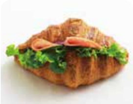
クロワッサンサンド ハム&季節の野菜 ¥385