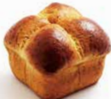
紅茶のブリオッシュ ¥506