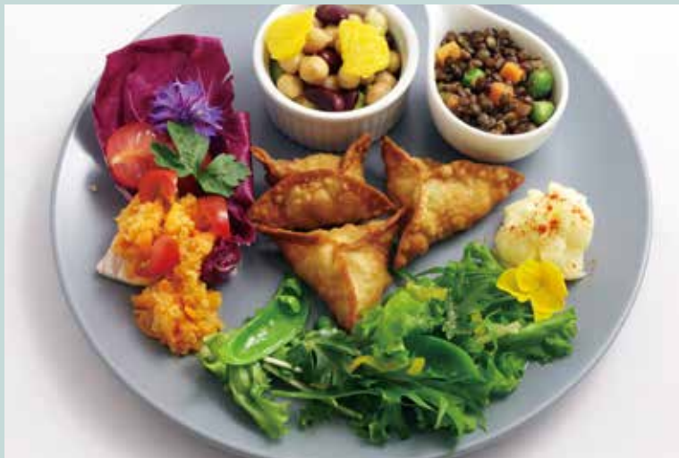
8周年記念 ベジタブルサモサプレート ¥2,400 単品 ¥1,600

*消費税は、お会計時に税別単価の合計に対し計算するため、税込金額を加算した金額と端数処理分に差異が生じる場合がございます*写真はイメージです