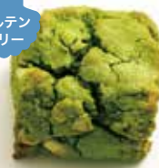
米粉のホワイトチョコと アーモンド入り抹茶スコーン ¥319