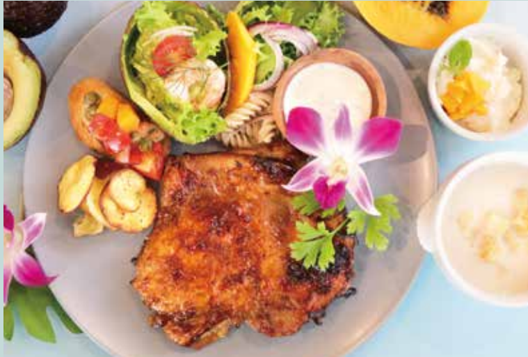
8周年記念 チキンセット ¥2,860