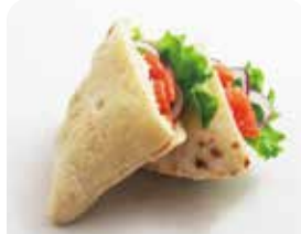
サーモン・ピタパン ¥595