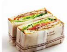
パストラミサンド ¥479