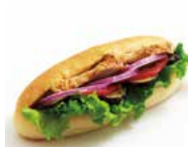
グリルチキンサンド ¥352