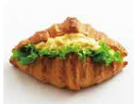
クロワッサンサンド たまご ¥347