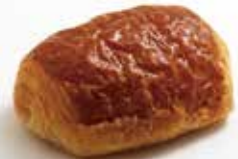
パン・オ・ショコラ ¥253