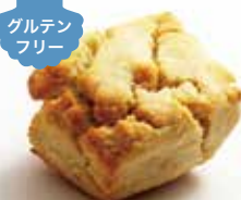
米粉のプレーンスコーン ¥253