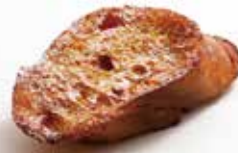
フレンチトースト ¥253