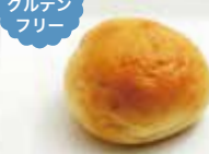
グルテンフリーのブリオッシュ1コ ¥90