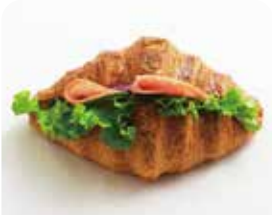
クロワッサンサンド ハム&季節の野菜 ¥385