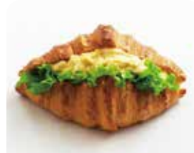
クロワッサンサンド たまご ¥347