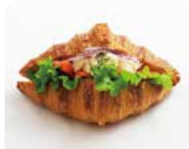
クロワッサンサンド サーモン&クリームチーズ ¥385