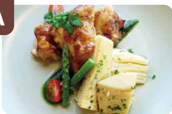
BIOTOPIA産 筍のコンソメポシェと 大山どりのグリル ジェノベーゼソース