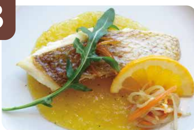
小田原漁港直送 真鯛のソテー 爽やか柑橘ソース